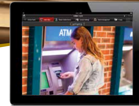
iVMS-5200 Mobil kliens